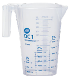
9888 Jarra graduada DC1