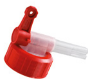
9834A Grifo para el bidón de almacenaje Komet (3l, 5l y 10l)