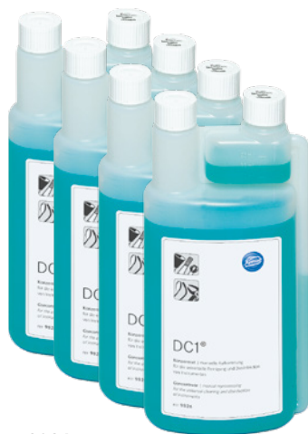
9826 (4 x 1l, frasco dosificador práctico)