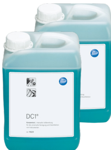
9829 (Envase doble 2 x 3l)